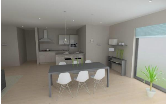
Keuken appartement A 0.1

Azalealaan 10 2980 Halle-Zoersel GSM 0477/30.73.97