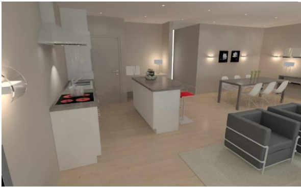
Keuken appartement C 0.1

Azalealaan 10 2980 Halle-Zoersel GSM 0477/30.73.97