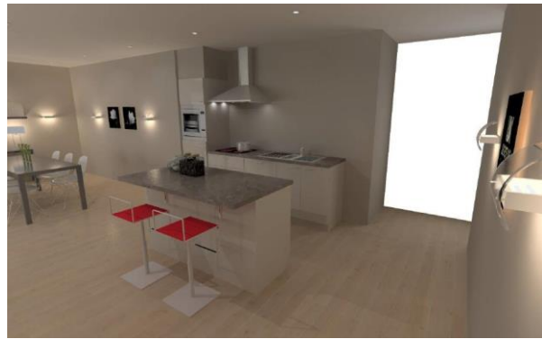
Keuken appartement C 0.5