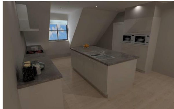
Keuken appartement C 2.4