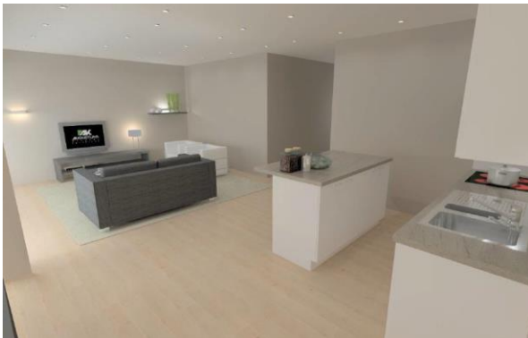
Keuken appartement C 1.3