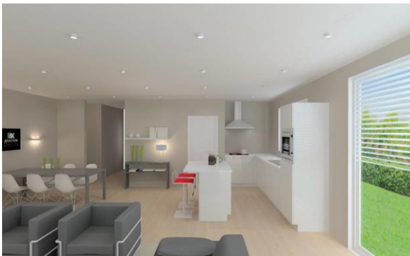
Keuken appartement B 0.1