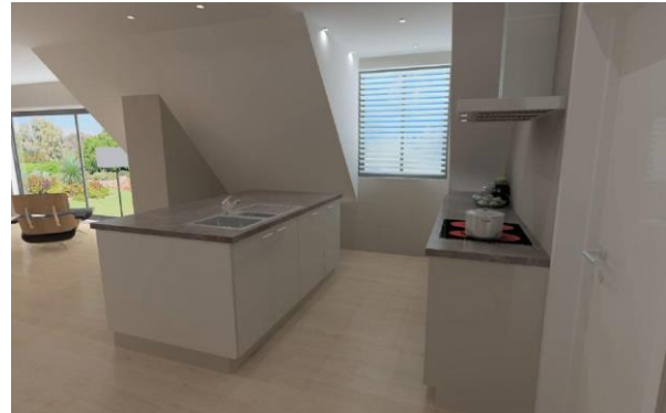
Keuken appartement A 2.2