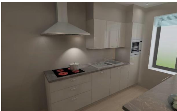
Keuken appartement A 0.3